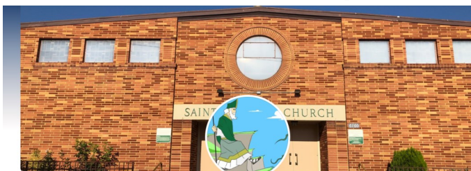
Saintpatrick Northhollywood Sanpatricio

Posts About Friends Photos Videos Sports More Friends Message