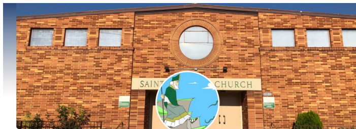
Saintpatrick Northhollywood Sanpatricio

Posts About Friends Photos Videos Sports More Friends Message