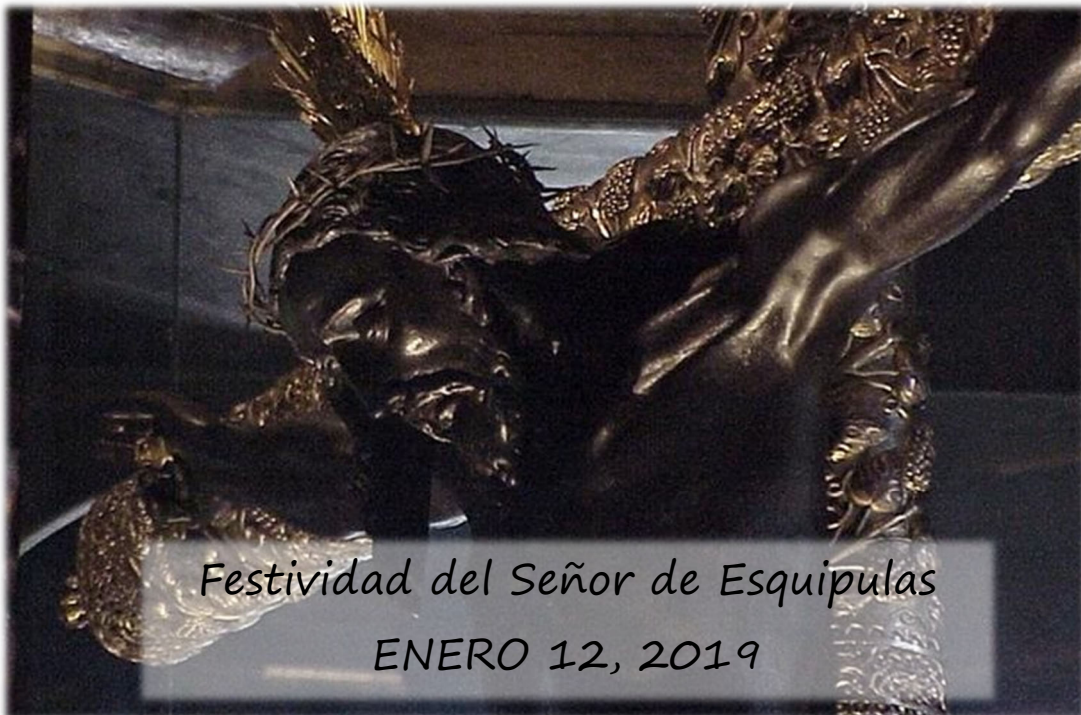
Festividad del Señor de Esquipulas ENERO 12, 2019