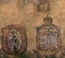
SANTISIMA VIRGEN DE GUADALUPE

"Metz - xic - co" que significan "en el centro de la luna".