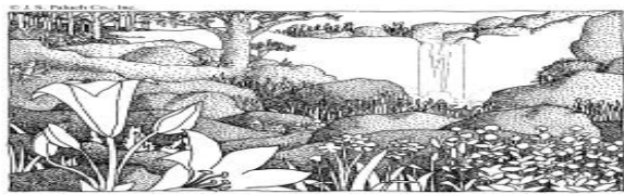
The Kingdom of Heaven Is at Hand.