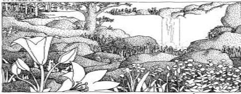
EL REINO DE LOS CIELOS ESTÁ CERCA